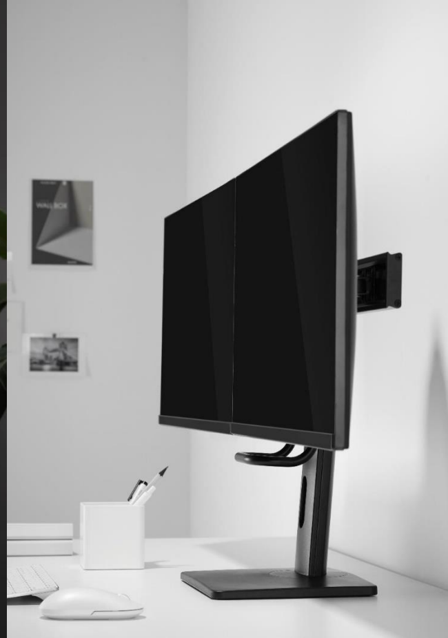
Double monitor desk stand ( PN / HM-SPMSD200 )